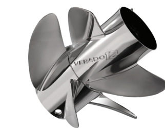
NUEVA HÉLICE CONTRARROTATORIA