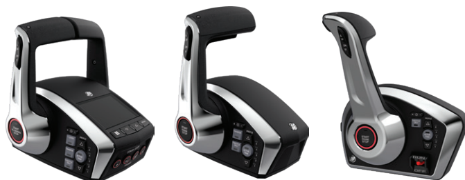
NUEVA GENERACIÓN DE CONTROLES