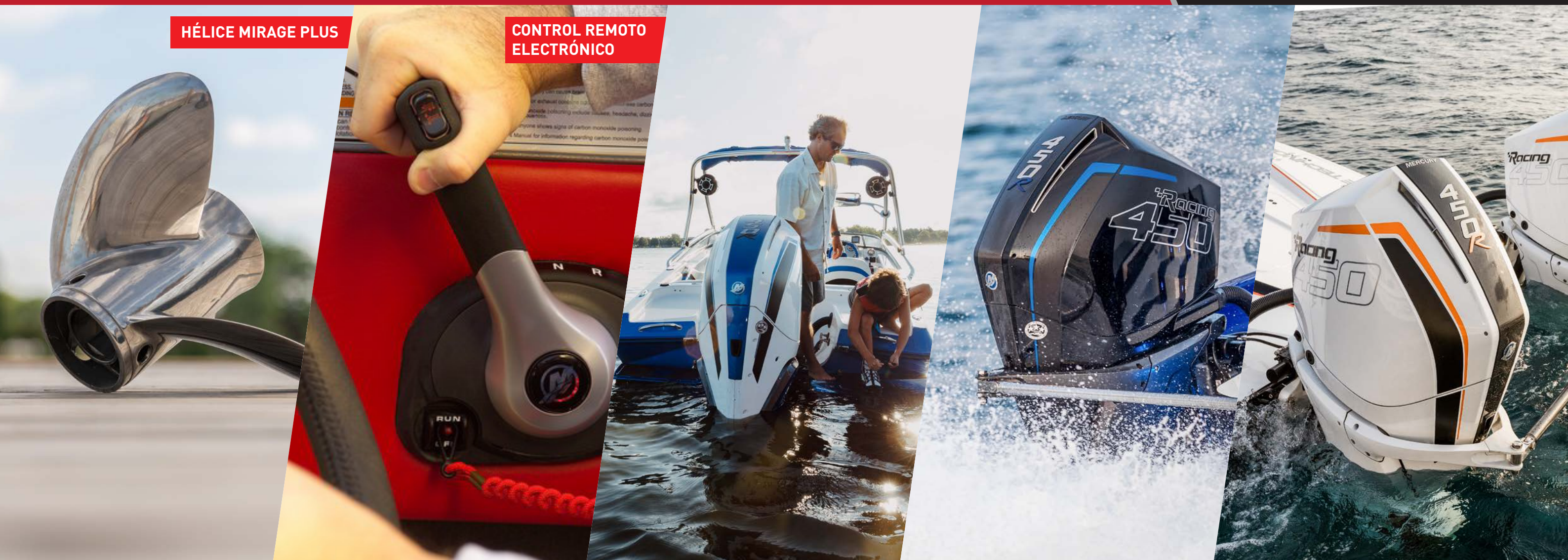
CONTROL REMOTO ELECTRÓNICO