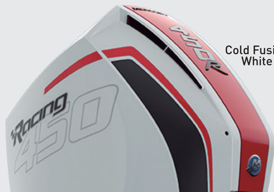
Cold Fusion White