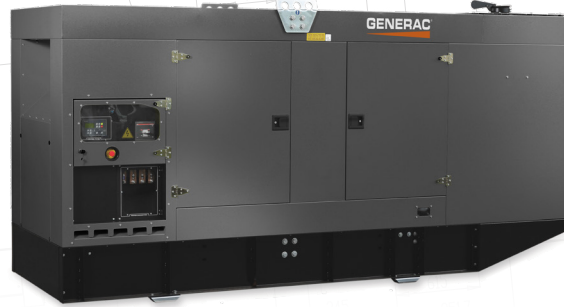
Imagem usada só para fins ilustrativos